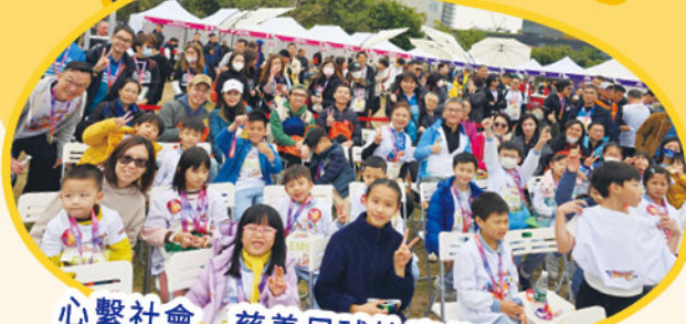
心繫社會 慈善足球比賽 慈善反詐跑