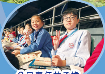
公民責任共承擔 團結同行建未來 公益少年團頒獎典禮