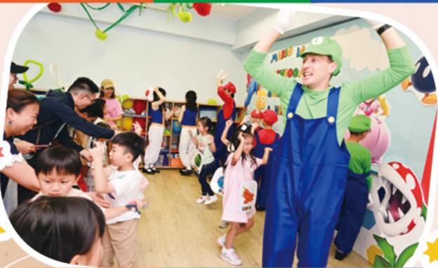
'Let's turn around to keep the fire burning!'

CCS Fun Day was a huge success, offering a perfect blend of education and entertainment. It provided a unique opportunity for students to immerse themselves in a beloved video game world while enhancing their language skills. The day left everyone with lasting memories and a renewed enthusiasm for learning.