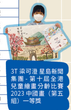
3T 梁可澄 星島新聞集團 - 第十屆全港兒童繪畫分齡比賽 2023 中國畫 (第五組) 一等獎