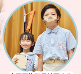
大哥哥拖帶學妹回座位