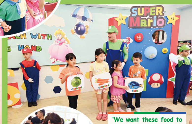
'We want these food to put in the hotpot with Mushroom Kings.'