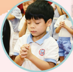
同學們一同誠心禱告