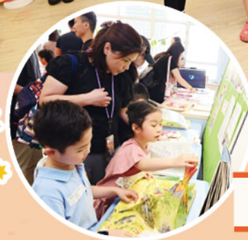
'Come and have a look at CCS students' work.'

The room was meticulously decorated to resemble scenes from the Mario world, complete with question mark blocks, green pipes, and colorful backdrops that transported everyone into the Mushroom Kingdom. The interactive activities were designed not only to entertain but also to enhance language learning, encouraging students to use English in creative and spontaneous ways.