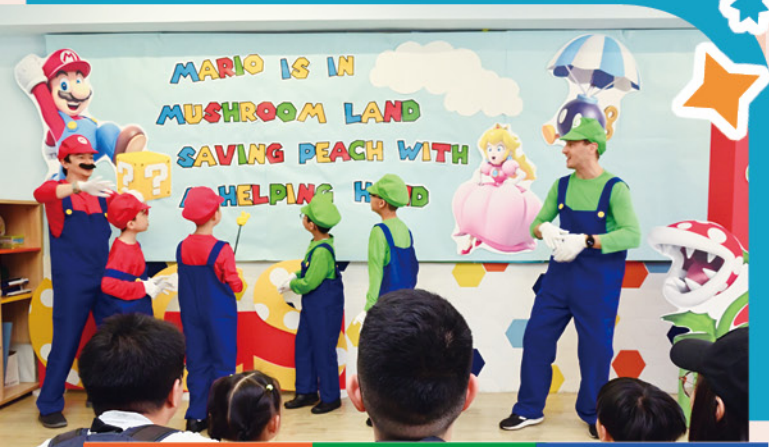
The young visitors all chanted with us, 'Mario is in Mushroom Land, Saving Peach with a helping hand.'