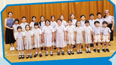
2023 亞洲學界音樂大賽 小一至小三合唱演唱組亞軍