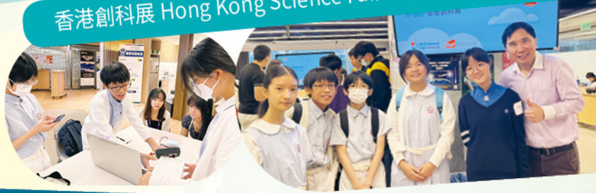
創客魔方機器人 STEM 比賽 (創客魔方機械人精英組：金獎、銀獎；創客魔方機械人 Smart 組：銀獎、銅獎；親子組：金獎)