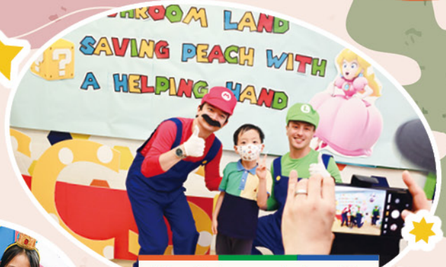
'May I have a photo with the characters?'

Imagine CCS transforming into Universal Studios, bringing the exciting world of Mario and Luigi to life! That's exactly what happened on CCS Fun Day, held on April 13, 2024. Our English room was themed around the iconic Mario games, creating an unforgettable and immersive experience for everyone involved.